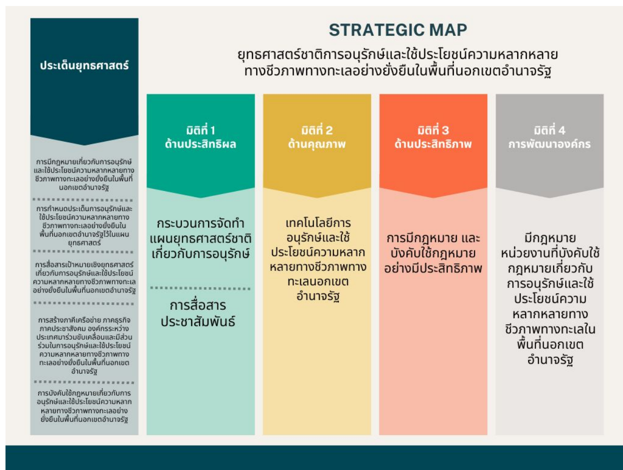
ภาพที่ ๒ แผนที่ยุทธศาสตร์ชาติการอนุรักษ์และใช้ประโยชน์ความหลากหลายทางชีวภาพทางทะเลอย่างยั่งยืนในพื้นที่นอกเขตอำนาจรัฐ