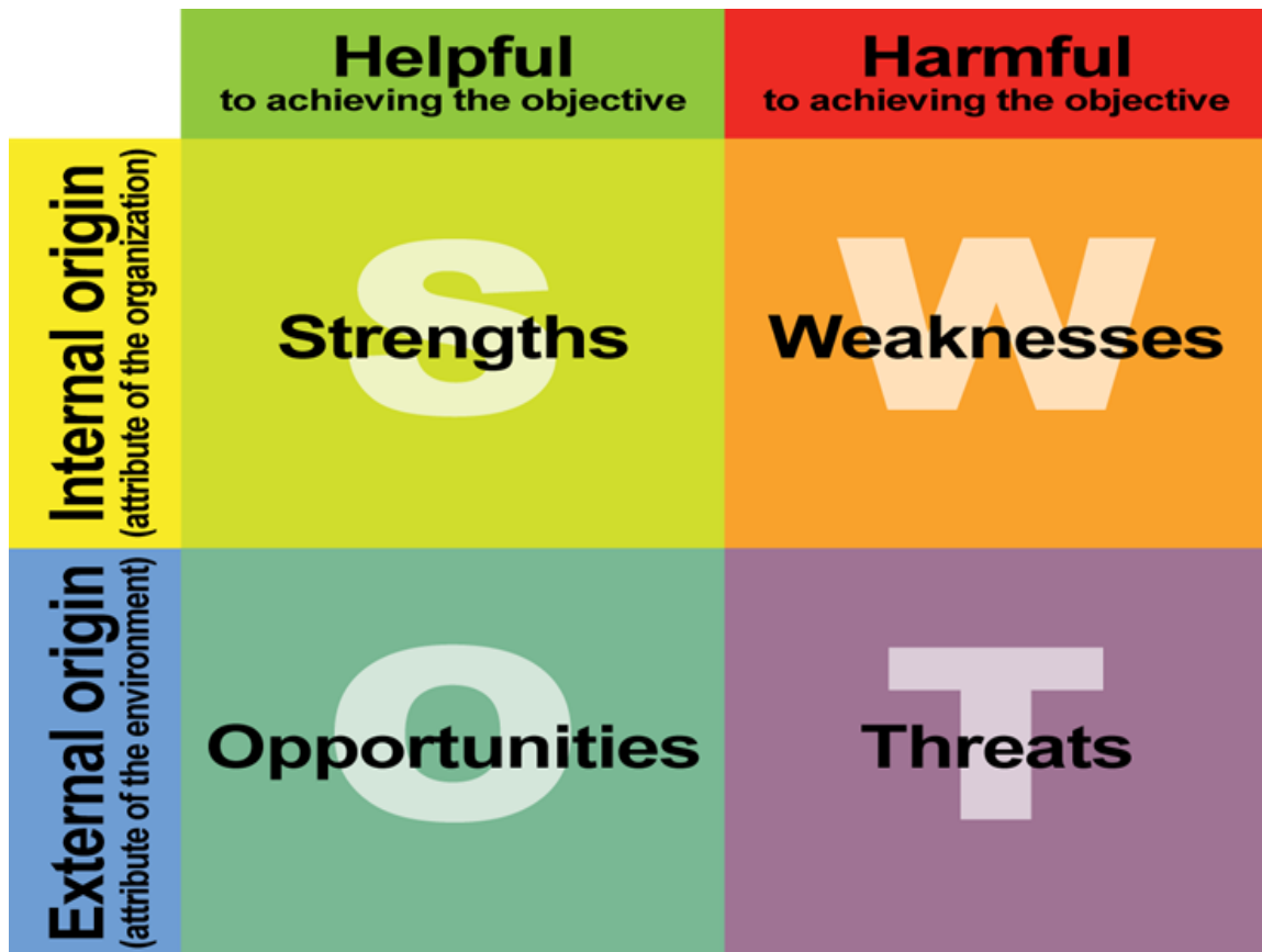
ตารางที่ 2-4 การรวบรวมจุดแข็ง จุดอ่อน โอกาสและภัยคุกคามที่ได้จากการวิเคราะห์

แผนภาพที่ 2.1 แนวคิด SWOT วิเคราะห์สภาวะแวดล้อมภายใน