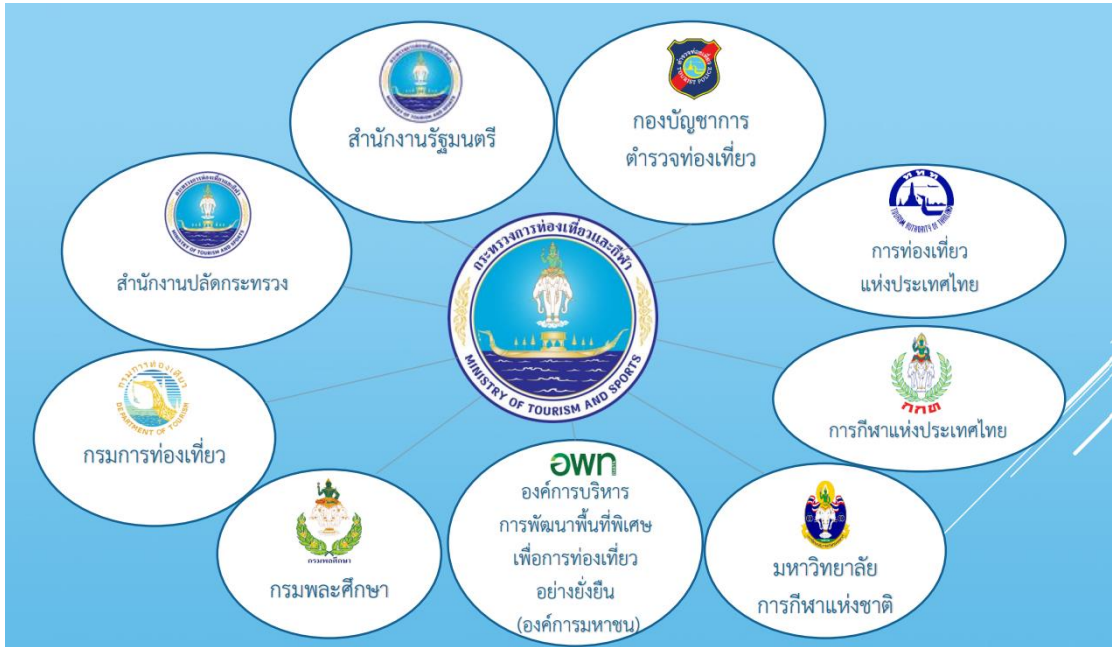
แผนภาพที่ 2.2 โครงสร้างหน่วยงาน ของกระทรวงการท่องเที่ยวและกีฬา

การกำกับดูแลของรัฐมนตรีว่าการกระทรวงการท่องเที่ยว ตามโครงสร้างหน่วยงาน ของกระทรวงการท่องเที่ยวและกีฬา ดังนี้