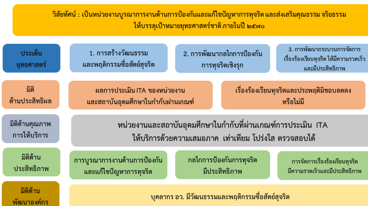
แผนภาพ 3.1 : แผนที่ยุทธศาสตร์ (Strategic Map)

4. มิติด้านพัฒนาองค์กร : เป็นเป้าประสงค์ที่เกี่ยวข้องกับการเตรียมความพร้อมกับการเปลี่ยนแปลงขององค์กรในการดำเนินงานตามยุทธศาสตร์ มี 1 เป้าประสงค์ คือ บุคลากร อว. มีวัฒนธรรมและพฤติกรรมซื่อสัตย์สุจริต