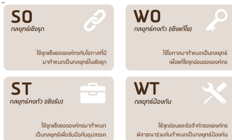
ภาพที่ 4 TOWS กับกลยุทธ์ทั้ง 4 รูปแบบ

เมื่อพิจารณาค่าคะแนนถ่วงน้ำหนัก จากการวิเคราะห์สภาพแวดล้อมของ ศูนย์ศึกษา ยุทธศาสตร์ ในข้างต้นจะพบว่า การวางกรอบทิศทางของศูนย์ศึกษายุทธศาสตร์ ควรจะให้น้ำหนักในการ กำหนดตำแหน่งทางยุทธศาสตร์ที่เกิดจากการจับคู่ระหว่าง สภาพแวดล้อมภายในทางลบคือ จุดอ่อน กับสภาพแวดล้อมภายนอกทางบวกคือ โอกาส เป็นกลยุทธ์เชิงแก้ไข (W-O) โดยการใช้โอกาสมาแก้ไข หรือกลบจุดอ่อนขององค์กร ตามภาพที่ 4