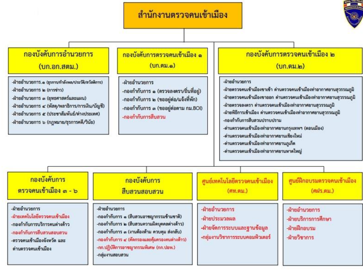
แผนภาพที่ ๒ โครงสร้างสำนักงานตรวจคนเข้าเมือง