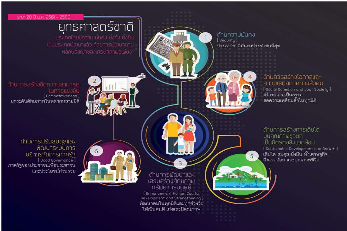
แผนภาพที่ ๑ ยุทธศาสตร์ชาติระยะ ๒๐ ปี (พ.ศ. ๒๕๖๑ - ๒๕๘๐)

ประสิทธิภาพการใช้งบประมาณ ๘. กระบวนการยุติธรรมเคารพสิทธิมนุษยชนและปฏิบัติต่อประชาชน โดยเสมอภาค โดย (๑) บุคลากรและหน่วยงานในกระบวนการยุติธรรมเคารพและยึดมั่นในหลักประชาธิปไตย เคารพศักดิ์ศรีความเป็นมนุษย์ที่พึงได้รับการปฏิบัติอย่างเท่าเทียม (๒) ทุกหน่วยงานในกระบวนการยุติธรรม มีบทบาทเชิงรุกร่วมกันในทุกขั้นตอนของการค้นหาความจริง (๓) หน่วยงานในกระบวนการยุติธรรมทั้งทางแพ่งอาญา และปกครองมีเป้าหมายและยุทธศาสตร์ร่วมกัน (๔) ส่งเสริมระบบยุติธรรมทางเลือก ระบบยุติธรรมชุมชน และการมีส่วนร่วมของประชาชนในกระบวนการยุติธรรม และ (๕) พัฒนามาตรการอื่นแทนโทษทางอาญา