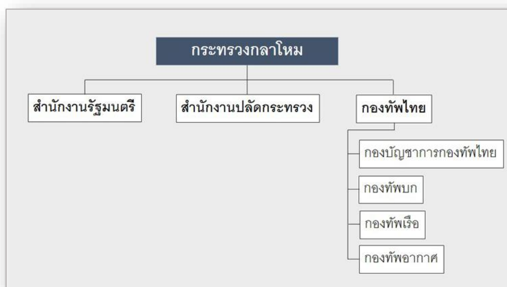
ภาพที่ ๒ แสดงส่วนราชการของกระทรวงกลาโหม

๓.๕ ส่วนราชการอื่นตามที่กำหนดโดยพระราชกฤษฎีกา