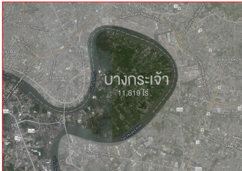
แผนภาพที่ ๑ ลักษณะภูมิประเทศบริเวณบางกะเจ้า อำเภอพระประแดง จังหวัดสมุทรปราการ

ความเป็นมาของการอนุรักษ์พื้นที่สีเขียวค้ำบางกะเจ้าเริ่มต้นจากในช่วงปี พ.ศ. ๒๕๒๕- ๒๕๓๐ พระบาทสมเด็จพระปรมินทรมหาภูมิพลอดุลยเดชฯ (ร.๙) ได้ประทับเฮลิคอปเตอร์พระที่นั่งผ่านบริเวณค้ำบางกะเจ้าเป็นประจำ และมีพระราชดำริว่า สมควรสงวนพื้นที่แห่งนี้ไว้สำหรับเป็นพื้นที่สีเขียวและเป็นปอดของกรุงเทพมหานคร เนื่องจากลมมรสุมจากอ่าวไทยจะพัดเอาอากาศบริสุทธิ์ที่ผลิตจากพื้นที่แห่งนี้เข้าไปพอกอากาศเสียในกรุงเทพฯ เป็นเวลากว่าปีละ ๙ เดือน โดยกายภาพทางภูมิศาสตร์แล้ว บริเวณฝั่งตรงข้ามแม่น้ำเจ้าพระยากับค้ำบางกะเจ้ามี ๒ กิโลเมตร มีประชากรอาศัยอยู่ประมาณ ๑.๕ ล้านคน มีอาคารค่อนข้างหนาแน่น มีทั้งท่าเรือขนาดใหญ่ โรงงานอุตสาหกรรม และที่พักอาศัย หากไม่สามารถรักษาพื้นที่สีเขียวบริเวณบางกะเจ้าเอาไว้ ปัญหาวันพิษจากโรงงานอุตสาหกรรมที่มีอยู่โดยรอบพื้นที่ปัจจุบันจะผ่านเลยเข้ามาถึงในเขตยานนาวา ถนนพระราม ๔ โดยปราศจากแนวกรองอากาศจนทำให้เกิดมลภาวะอย่างแน่นอน (หนึ่งนุช, ๒๕๔๙)