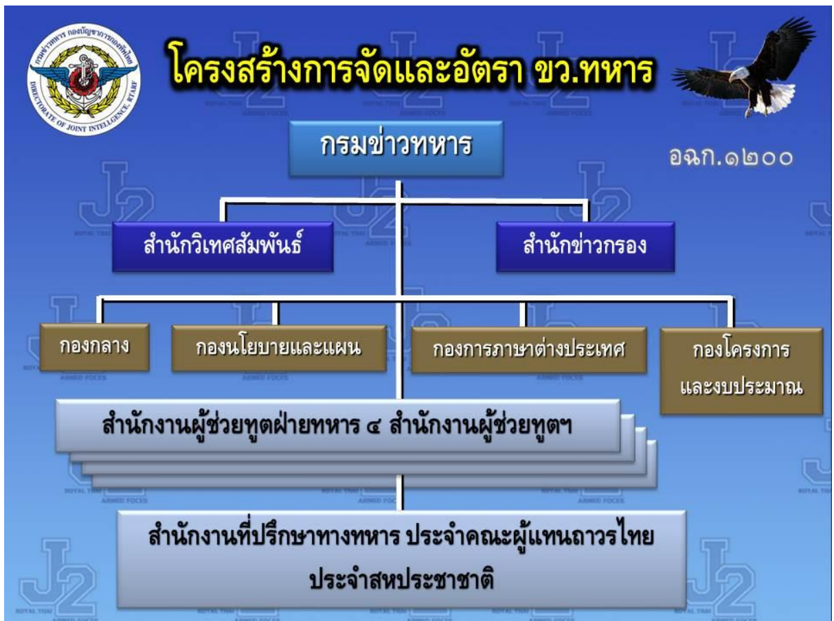
ภาพที่ 2 โครงสร้างการ จัดกรมข่าวทหาร

เพิ่มกองใหม่จำนวน 2 กอง ได้แก่ กองโครงการและงบประมาณ และกองข่าวความมั่นคง สำนักข่าวกรอง กรมข่าวทหาร และปรับปรุงภารกิจ หน้าที่ของกองต่างๆ จำนวน 5 กอง ประกอบด้วย กองนโยบายและแผน กองการภาษาต่างประเทศ สำนักข่าวกรอง ได้แก่ กองข่าวยุทธศาสตร์ กองต่อต้านข่าวกรอง กองข่าวกรองเทคนิค และเทคโนโลยีข่าวกรอง โดยมีรายละเอียดดังนี้