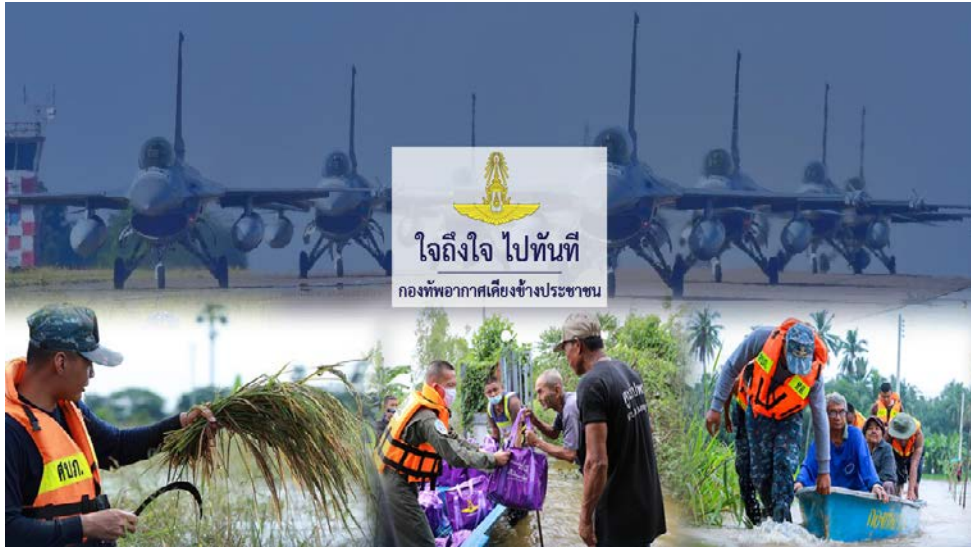
ศูนย์บรรเทาสาธารณภัยกองบิน ๑