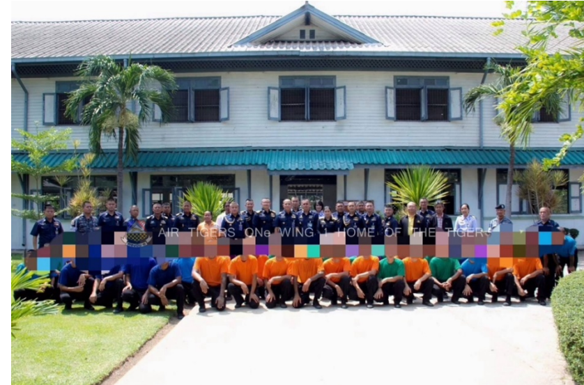
ศูนย์ฟื้นฟูสมรรถภาพผู้ติดยาเสพติด กองบิน ๑