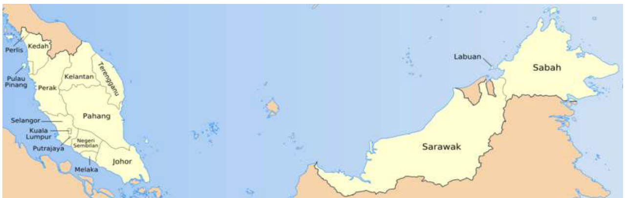
ภาพที่ 1 แผนที่สหพันธรัฐมาเลเซีย 5

ลักษณะภูมิประเทศ: มาเลเซียเป็นประเทศในภูมิภาคเอเชียตะวันออกเฉียงใต้ แบ่งลักษณะทางภูมิประเทศออกเป็น 2 ส่วน โดยมีทะเลจีนใต้กั้น ส่วนแรก คือ คาบสมุทรมลายูมีพรมแดนทิศเหนือติดประเทศไทย และทิศใต้ติดสิงคโปร์ ภูมิประเทศบนแหลมมลายูเป็นหนองบึงตามชายฝั่ง และพื้นดินจะสูงขึ้นเป็นลำดับ จนกลายเป็นแนวเขาด้านในของประเทศ โดยมีพื้นที่ราบอยู่ ระหว่างแม่น้ำสายต่างๆ พื้นดินไม่ค่อยอุดมสมบูรณ์นัก แต่เหมาะสำหรับปลูกยางพาราและต้นปาล์ม ด้านในของประเทศจะมีพืชพันธุ์ไม้نانาชนิดขึ้นตามบริเวณป่าดงดิบ โดยเฉพาะในแถบภูเขาซึ่งมีความสูงระหว่าง 150 - 2,207 เมตรเหนือระดับน้ำทะเล มีความยาว ชายฝั่งจากด้านเหนือติดชายแดนไทยถึงปลายแหลมประมาณ 804 กิโลเมตร และความกว้างของแหลมส่วนที่กว้างที่สุดประมาณ 330 กิโลเมตร ส่วนที่สอง คือ ทางเหนือของเกาะบอร์เนียวมีพรมแดนทิศใต้ ติดอินโดนีเซีย และมีพรมแดนล้อมรอบประเทศบรูไน ภูมิประเทศ บนเกาะบอร์เนียวเป็นพื้นที่ราบตามชายฝั่ง และมีภูเขาเรียงราย อยู่ด้านใน โดยมีความสูงตั้งแต่ 30 - 2,440 เมตรเหนือระดับน้ำทะเล ทางตอนเหนือของเกาะเป็นแหล่งน้ำมันและก๊าซธรรมชาติที่สำคัญ ความกว้างจากชายฝั่งทะเลถึงอาณาเขตที่ติดกับกะลิมันตันของอินโดนีเซีย ประมาณ 270 กิโลเมตร และชายฝั่งยาว 1,120 กิโลเมตร ในส่วนอาณาเขตที่ติดต่อกับกะลิมันตัน