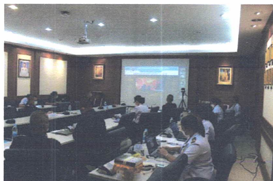
บรรยากาศการสนทนา