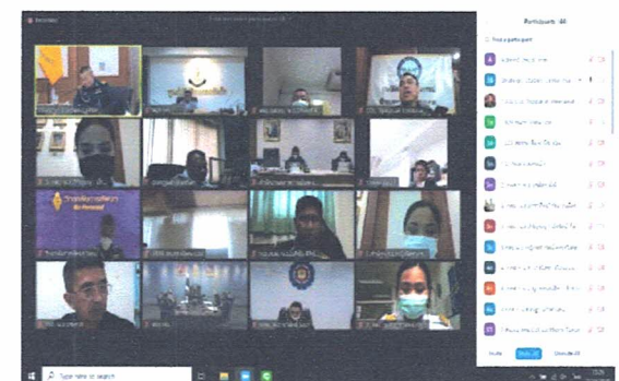
ผู้เข้าร่วมประชุมผ่านระบบ App. Zoom