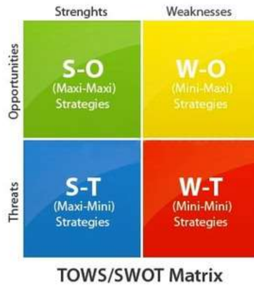
แผนภาพที่ 2-1 TOWS/SWOT Matrix

จากคะแนนที่ได้จากการวิเคราะห์สภาพแวดล้อมภายในและภายนอกดังกล่าว สามารถจัดทำกราฟแสดงสถานภาพของสำนักงานอัยการสูงสุดแนวทางของ Boston consulting group matrix model ด้วยการใช้ SWOT Analysis ได้ดังนี้