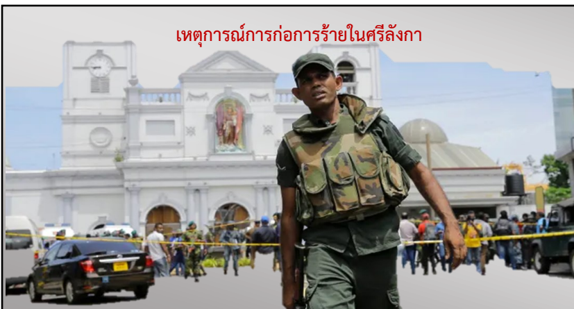
เหตุการณ์การก่อการร้ายในศรีลังกา

ศรีลังกาเป็นประเทศที่ตั้งอยู่ในภูมิภาคเอเชียใต้ อยู่ทางทิศตะวันออกเฉียงใต้ของอินเดีย มีประชากรประมาณ ๒๑ ล้านคน ส่วนใหญ่เป็นชาวสิงหล ๗๔% ชาวทมิฬ ๑๘% ชาวมัวร์ ๗% ชาวศรีลังกา นับถือศาสนาพุทธเถรวาท ๗๐% ฮินดู ๑๓% อิสลาม ๑๐% และคริสต์ ๗% จะเห็นได้ว่าประเทศศรีลังกามีความหลากหลายทางเชื้อชาติศาสนา ส่งผลให้ตั้งแต่อดีตจนถึงปัจจุบันศรีลังกาเป็นประเทศที่มีความขัดแย้งทางศาสนาและชาติพันธุ์จนเกิดเป็นกลุ่มแบ่งแยกดินแดนหลายกลุ่ม และเป็นปัญหาเรื้อรังของรัฐบาลชุดต่าง ๆ ของศรีลังกา ดังนั้นสาเหตุการก่อการร้ายครั้งนี้จึงมีความเกี่ยวข้องกับปัญหาภายในของศรีลังกา ความมั่นคงและการข่าว รวมทั้งการฟ่ายแพ้และการสูญเสียฐานที่มั่นสุดท้ายของกลุ่ม IS ในอิรักและซีเรีย ด้วยเหตุนี้จึงสามารถวิเคราะห์เหตุการณ์ที่เกิดขึ้นได้ดังนี้