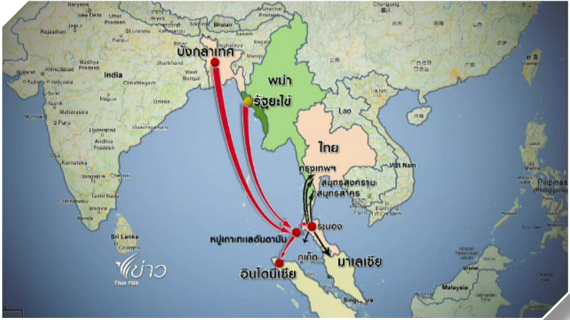
ภาพที่ ๑ ภาพแสดงเส้นทางการเคลื่อนย้ายถิ่นฐานแบบไม่ปกติของชาวบังกลาดี เข้าสู่ประเทศไทย

ในฐานะที่ไทยเป็นประเทศทางผ่าน และประเทศปลายทางหนึ่ง สำหรับผู้ย้ายถิ่นจำนวนมากจากทั้งภายในภูมิภาคและทั่วโลก กระแสการย้ายถิ่นของแรงงานประเทศเพื่อนบ้านในประเทศไทยมีทั้งความซับซ้อนและความเป็นพลวัต ในบริบทของภูมิภาคที่กำลังมีการเติบโตโดยเฉพาะเมื่อเผชิญกับความเป็นไปได้ที่แรงงานย้ายถิ่นและคนผลิตภัณฑ์จากประเทศเมียนมาจำนวนมากจะย้ายกลับมาตุภูมิในอนาคต ทั้งนี้ประเทศไทย มีอาณาเขตติดต่อกับเมียนมา ลาว กัมพูชาและมาเลเซีย เอื้อต่อการพัฒนาให้เป็นศูนย์กลางการคมนาคมในภูมิภาคซึ่งส่งผลต่อการพัฒนาเศรษฐกิจในประเทศ ขณะเดียวกัน การมีพื้นที่ติดต่อกันหลายกิโลเมตรได้กลายเป็นข้อท้าทายในการบริหารจัดการชายแดนของประเทศ และการป้องกันการหลบหนีเข้าเมืองมาในประเทศซึ่งก่อให้เกิดผลกระทบต่อความมั่นคงของไทย เนื่องจากแรงงานโยกย้ายถิ่นฐานเข้าประเทศมาทางเมียนมา ลาว และกัมพูชาที่ทำงานอย่างผิดกฎหมายกว่า ๓ ล้านคน นอกจากนี้ ยังมีบางส่วนที่ลักลอบเข้าประเทศเนื่องจากสถานการณ์ประเทศต้นทางไม่ปลอดภัย ไม่สามารถกลับไปยังประเทศต้นทาง และตกค้างอยู่ในประเทศไทยประมาณ ๑๐๐,๐๐๐ คน