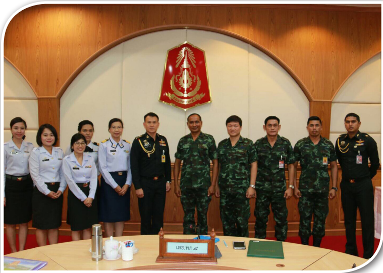
วันที่ ๖ มิ.ย.๖๐ คณะวิจัย ศศย.สปท. เข้าประชุมรับฟัง และแลกเปลี่ยนข้อมูล ณ ทภ.๔ จ.นครศรีธรรมราช เพื่อเก็บรวบรวมข้อมูลสนับสนุนเอกสารศึกษาเฉพาะกรณี