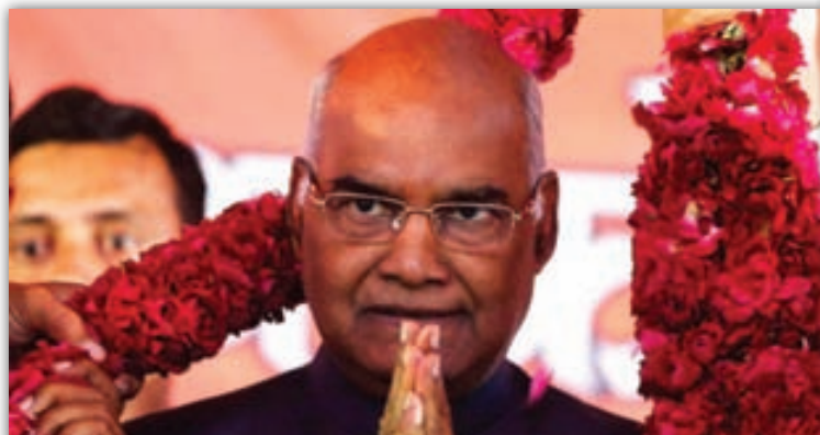
นายราม นาถ โกวินท์ ประธานาธิบดีคนใหม่ของอินเดีย

(Electoral College) ทั้งหมด ส่วนนางมีรา กุมาร ซึ่งเป็นผู้สมัครที่พรรคร่วมฝ่ายค้านให้การสนับสนุน ได้รับคะแนนเสียง 1,844 เสียง คำนวณแล้วเท่ากับ 367,314 คะแนน คิดเป็นร้อยละ 34.35